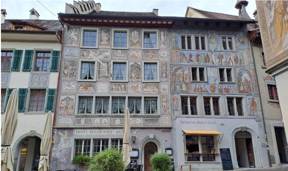
Stein am Rhein

Am letzten Tag vor der Heimreise „macht Jeder seins“, weil der Busfahrer heute den gesetzlich verordneten Ruhetag einhalten muß. Da wir eine Woche im Ort gewohnt haben, schaue ich mir Tettng an, womit ich ja relativ schnell durch bin. Am Nachmittag gibt es